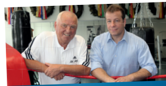
REINICKENDORF IST SPORTLICH