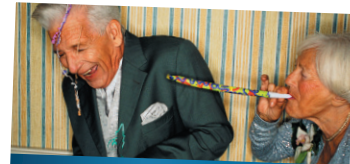
REINICKENDORF IST JUNG GEBLIEBEN