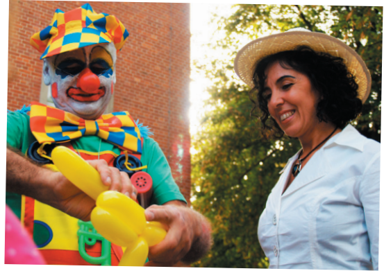
Familienpolitik hat seine schönen Seiten