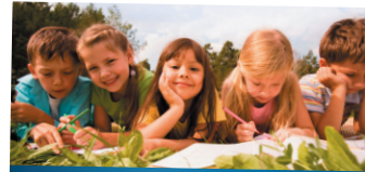
REINICKENDORF IST KLASSE